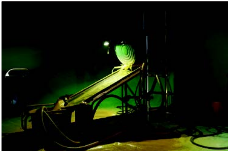
Ana Alenso, The mine gives, the mine takes , 2020.

Vue d'une partie de l'installation d'Ana Alenso qui sera présentée à la Villa du Parc (centre d'art contemporain). D'autres œuvres seront présentes à la Comédie de Genève.