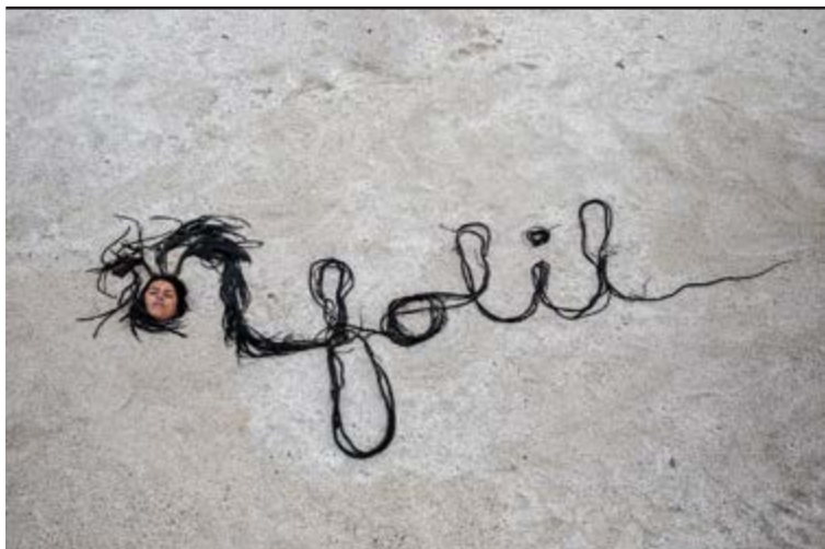
Seba Calfuqueo, FOLIL , 2025, Registro Diego Argote. ©Seba Calfuqueo

Vue d'une partie de l'installation d'Ana Alenso qui sera présentée à la Villa du Parc (centre d'art contemporain). D'autres œuvres seront présentes à la Comédie de Genève.