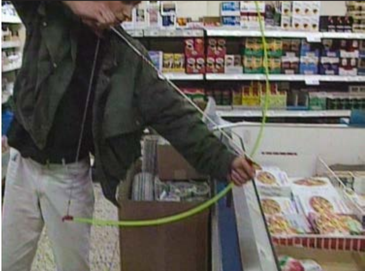
Christian Jankowski, Die Jagd , 1992, capture d'écran de la vidéo. ©Christian Jankowski

Cette vidéo sera visible sur les écrans MIRE, à la gare de Chêne-Bourg.