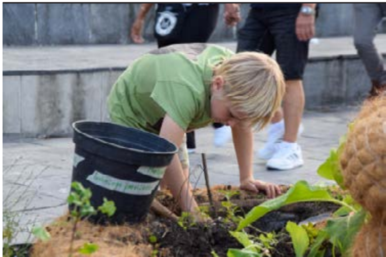
Biennale (re)connecting.earth (02), 2023, atelier botanique.