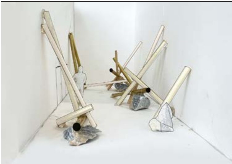
Séverin Guelpa, Energy as a Vehicle , mockup installation, 2025. ©Séverin Guelpa

Cette vidéo sera visible sur les écrans MIRE, à la gare de Chêne-Bourg.