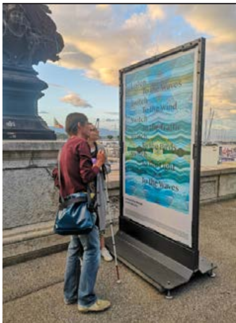
Visite guidée de la Biennale (re)connecting.earth (02), 2023