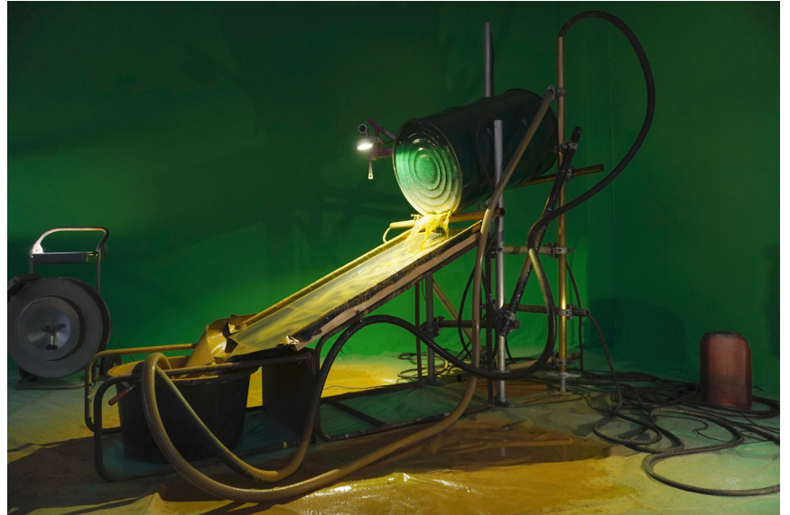
Ana Alenso, What the Mine Gives, The Mine Takes , installation, 2020