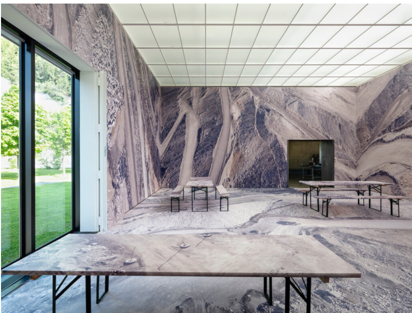
Mathias Kessler, Staging Nature , impression, 2016 (Kirchner Museum)