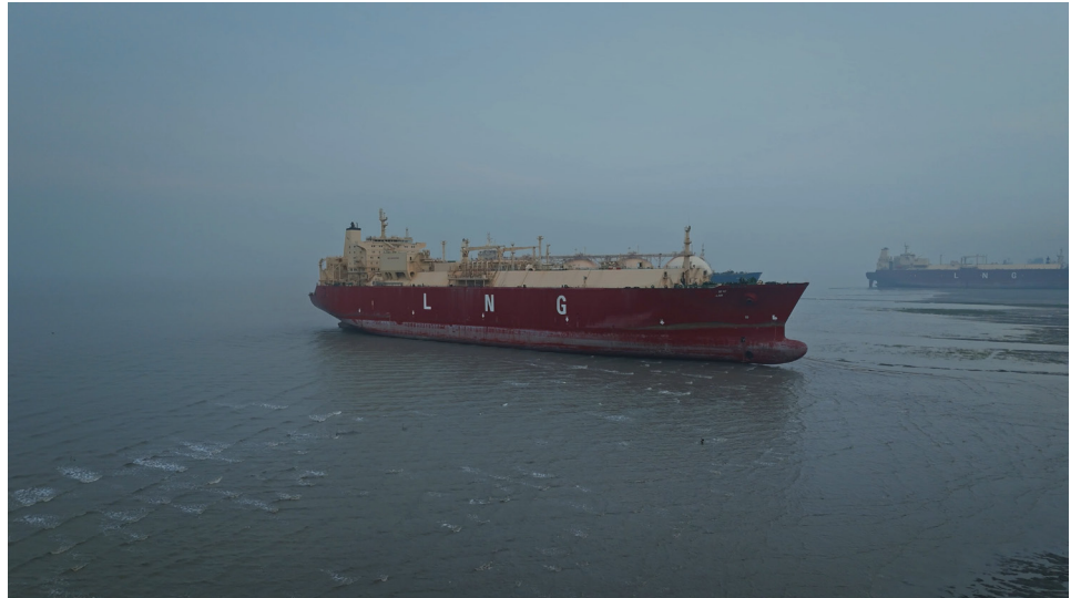
Monira Al Qadiri, Oh Body of Mine , vidéo, 2025