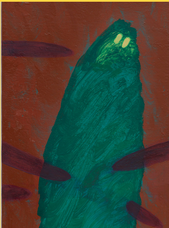
Flo Kasearu, Hedges Having a Row , 2025

Pelouse interdite exposition monographique