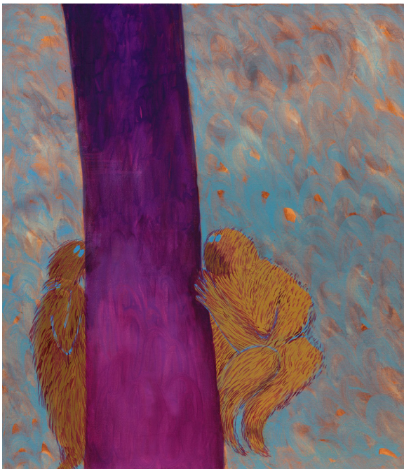
Flo Kasearu, Family Painting

Pour sa première exposition monographique en France, à la Villa du Parc, Flo Kasearu entreprend une enquête in situ à partir des archives du bâtiment. Elle puise dans les multiples vies de cette villa bourgeoise construite en 1865 : dès 1930 le bâtiment fait office de tribunal d'instance, de bureau de police, de service des impôts, mais aussi lieu d'habitation pour des familles. À partir de ces strates institutionnelles et domestiques, elle imagine une fiction où le regard d'une enfant solitaire, habitant les lieux dans les années 1950, devient le fil conducteur d'un récit tissé entre mémoire, jeu et pouvoir.