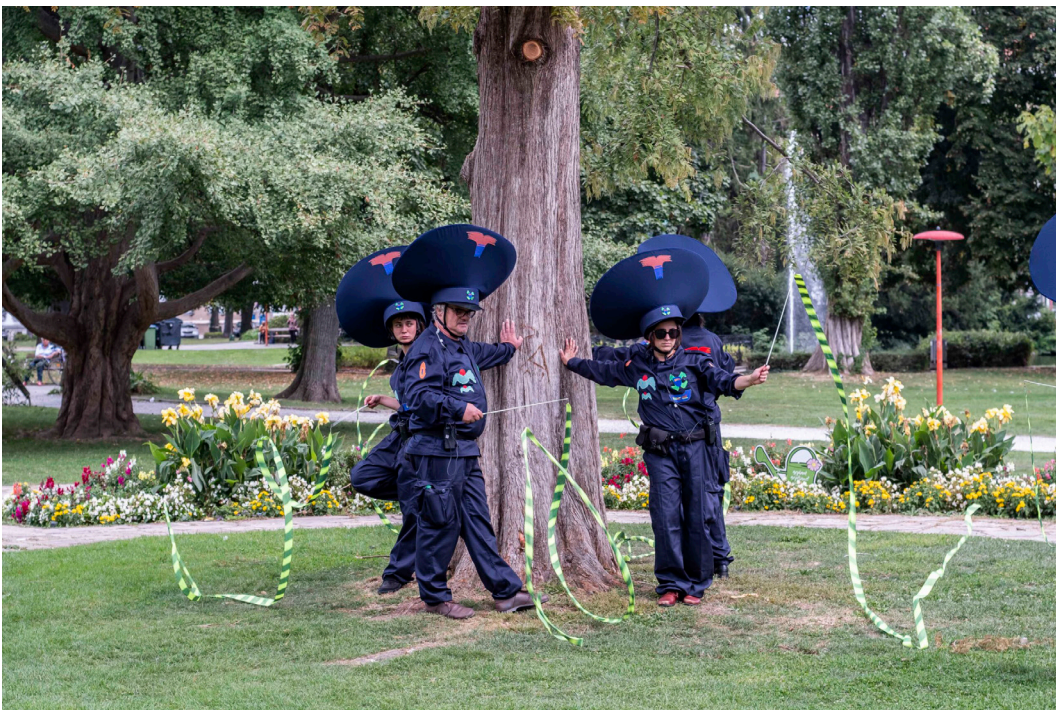
Flo Kasearu, Disorder patrol , 2021