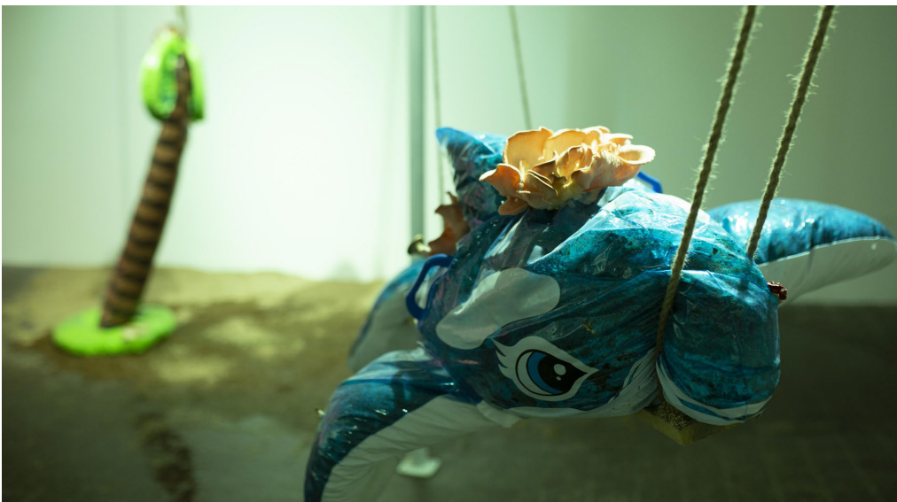
Yael Kempf, Missile , 2019