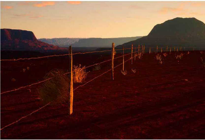
Tanguy Benoit, capture d'écran du Jeu vidéo , 2021