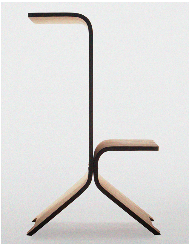
Félix Léon, Valet , 2020