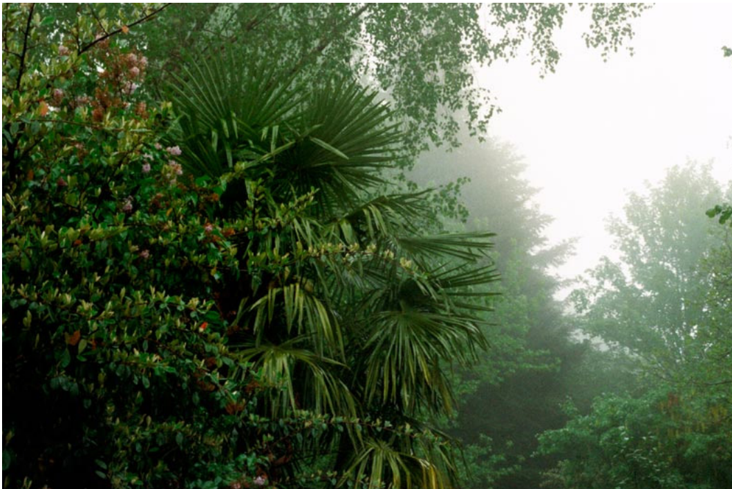
Ludivine Zambon, Laver les pierres , installation photographique, 2022