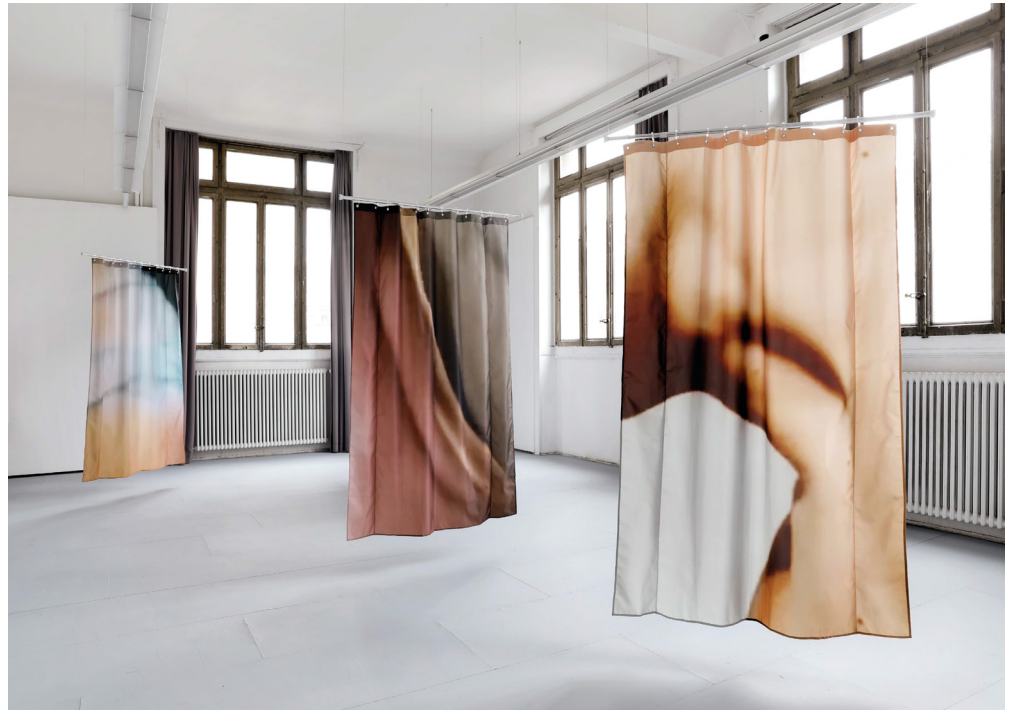
Neige Sanchez, A Room for Abstraction , 2021