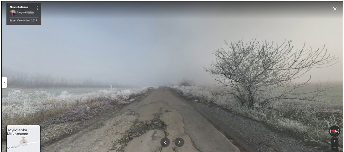
Marie Chemin, Le fantôme de Marioupol , 2022