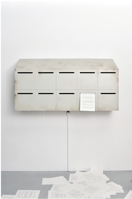
Julien Fournival, Dans le dos face au jardin , 2024