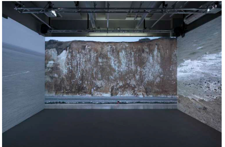
Eliot Ruffel, Ca nous rend plus vivant , 2021