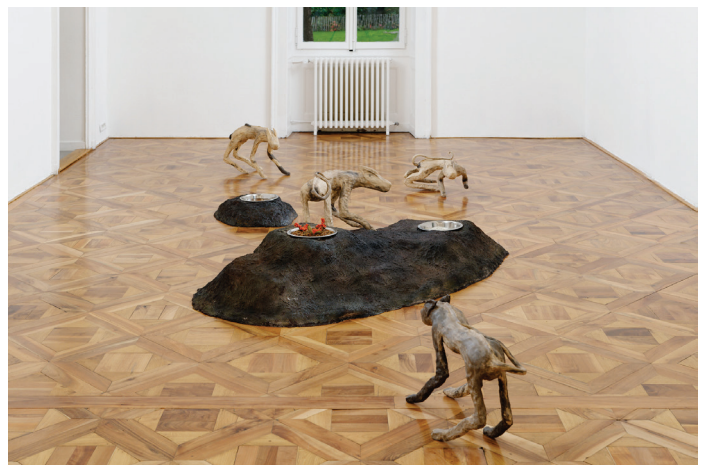
Julien Fournival