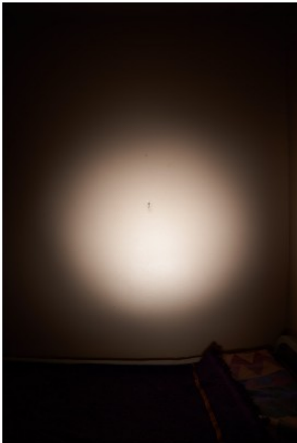
Karim Kal, Kosmos 2 , Maison d'Arrêt de Villefranche sur Saône.

L'élève sera invité(e) à explorer son environnement scolaire, et représenter son espace architectural au moyen de la photographie et d'un dispositif d'éclairages artificiels. Les frontières absolues que matérialisent et représentent les murs des classes, des couloirs, du réfectoire, du CDI... les murs intérieurs et extérieurs du bâtiment seront interrogés par le parti pris formel (cadrage, point de vue et éclairage) et les images produites à la limite l'abstraction questionneront sur le cloisonnement comme outil éducatif