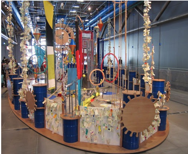
Soulever le monde, 2015

Artiste arpenteur, nomade, Jan Kopp court les rues au sens propre comme au figuré, à la recherche de signes et de questionnements liés à nos environnements quotidiens, temporels et physiques, politiques et poétiques.