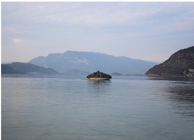
Maxime Lamarche, Austin's Island , 2017