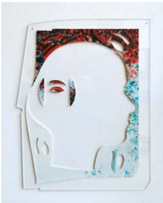
"Him: Les vœux, c'est plus important que voir " oil on cut out Laser engraved porcelain, acryl glass 45/34 cm 2020