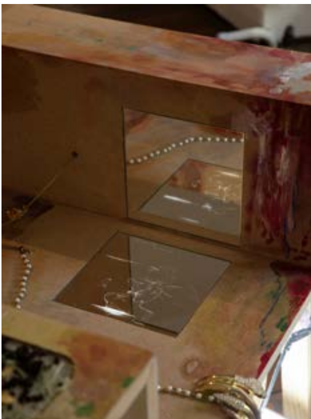
Monika Emmanuelle Kazi, Beauté na yo , 2020, Galerie du Crous (PDAC)