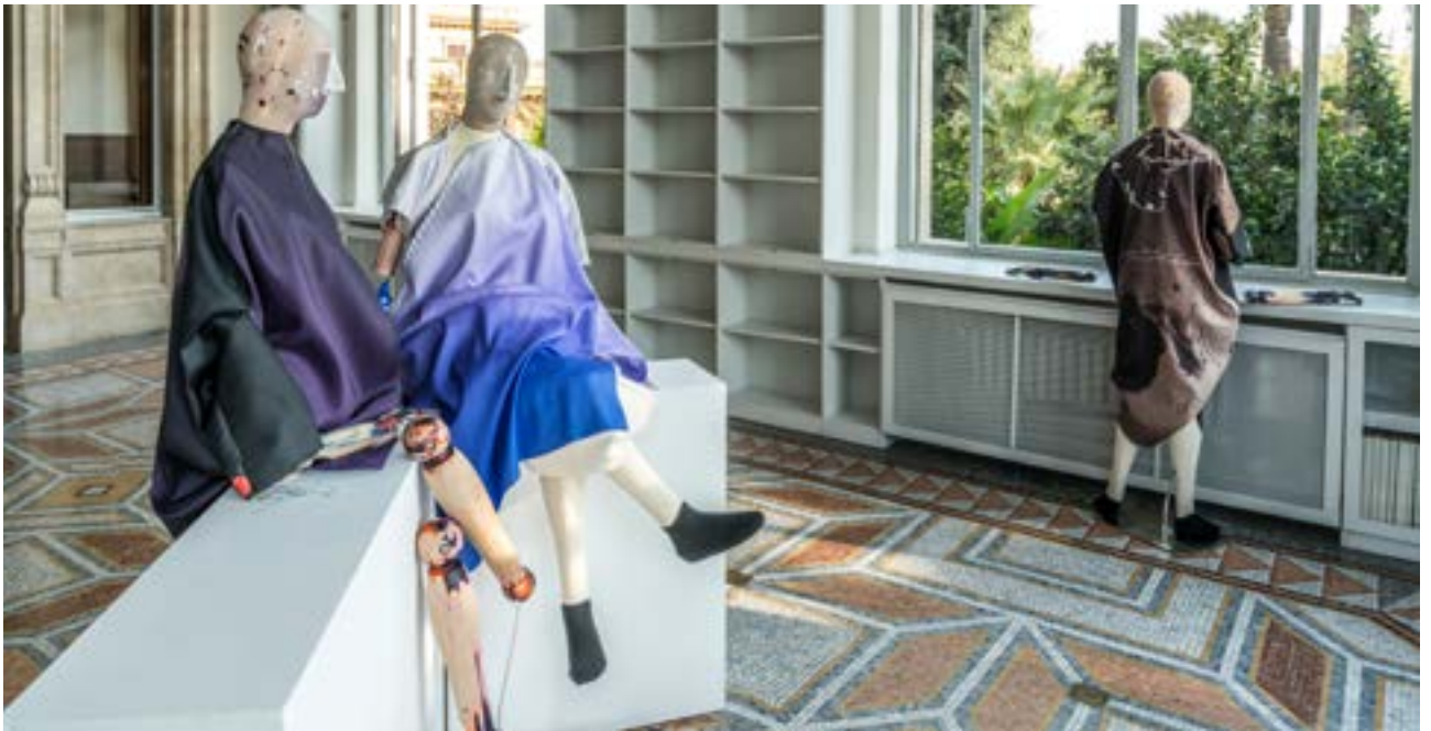
K., A., & Y. sublimation print on heavy satin, felted wool fabric, wood dummy, acrylic paint, cables, socks var. dim. 2016-2018 exhibition 'Ich, ich sehe dich' Istituto Svizzero, Rome, 2018