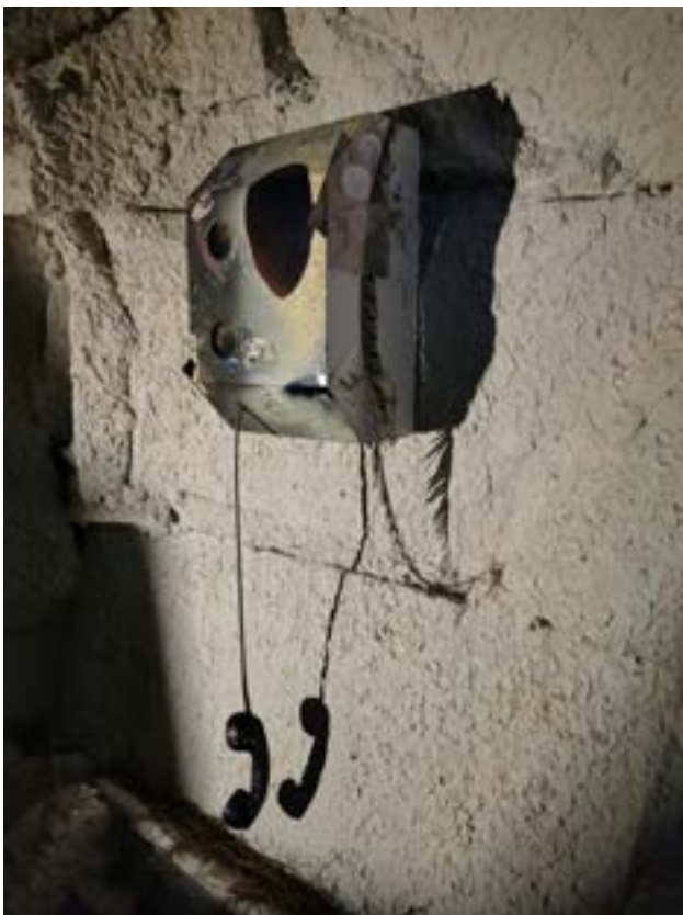
Elijah Soundtrack from Clarity System feat. Jessy Razafimandimby pine tree spikes from Lisbon and Marseille, paper, acrylic, Acrylglass, Lady Amherst Pheasant Feather, MDF, public phone ca. 55×35×15 cm 2022 exhibition 'Elijah', The Grotto, Quadrado Azul, Lisbon, 2021