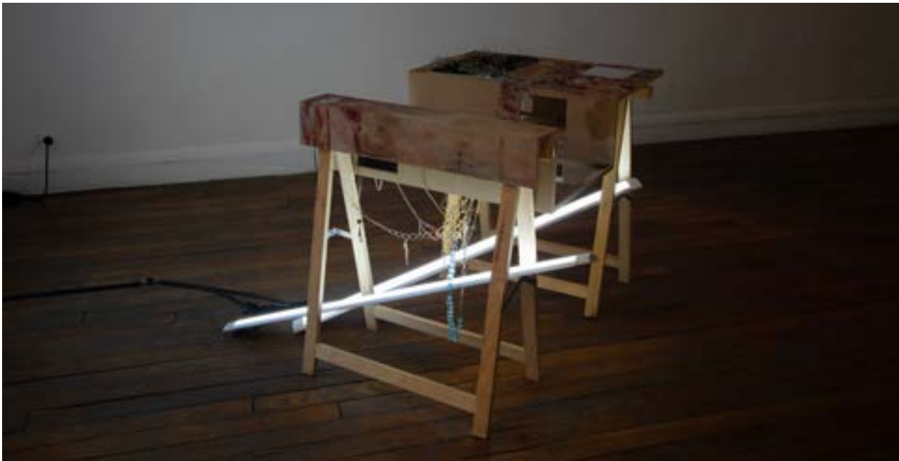
Monika Emmanuelle Kazi, Beauté na yo , 2020, Galerie du Crous (PDAC)