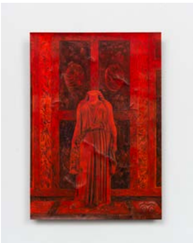
Mélôs A oil on Laser engraved porcelain 34,6/24,4 cm 2021