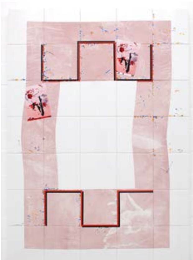
Lycaons and suricats acrylic, emulsion, varnish, stickers high density silk on tiles on wood 140/100/6 cm 2017