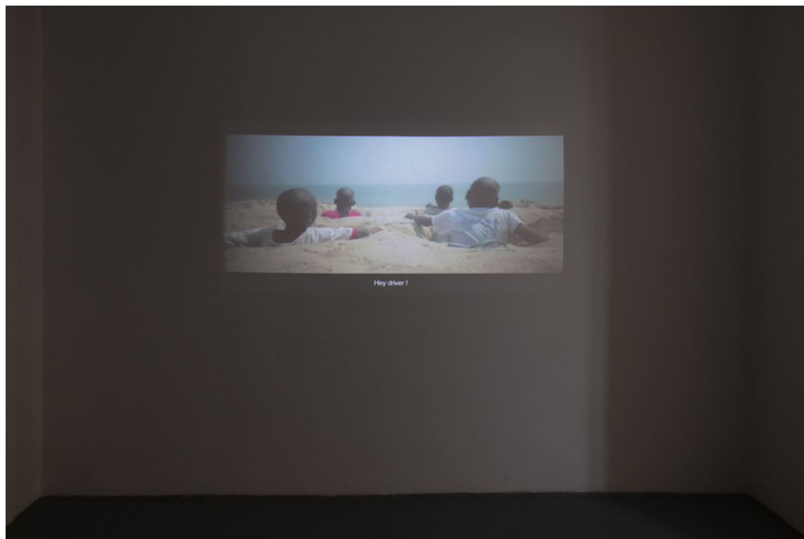
Binelde Hyrcan, « Cambeck », vidéo, 2015, Courtesy de l'artiste

Ainsi, la lecture du titre de l'exposition déclenche dans la pensée du visiteur des images qui se détachent à la manière d'une préfiguration, servant ensuite de cadre de résonance aux expériences sensibles et intellectuelles jalonnant son cheminement.