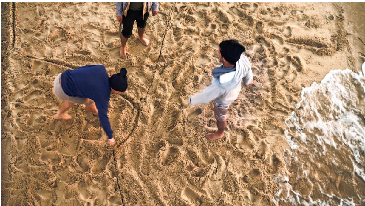
Sigalit Landau, « Azkelon », vidéo, 2011

Le jeu dit des couteaux, auquel nous assistons dans cette vidéo, retient notre attention dans le désir de le comprendre et d'en connaître l'issue. Mais il est filmé sans fin, si ce n'est que cette dernière se laisse supposer avec l'entrée soudaine dans le champ de l'image du déferlement d'une vague. Facteur prévisible, si l'on s'en réfère à la bande sonore, mais demeuré jusque-là invisible en raison du plan fixe de la caméra, la mer Méditerranée en faisant irruption rompt le cours des choses. Le scénario prend alors une tournure inattendue, puisqu'en ces lieux disputés par les hommes, rien ne peut s'opposer au mouvement d'origine cosmique qui, de fait, signe le retour à un ici d'une autre dimension, existant depuis les temps immémoriaux de la formation de la planète et des marées et rendant dérisoire l'échelle de l'action humaine. Le déplacement s'opère en deux temps, de l'ici local et géographique à l'ailleurs ludique, puis de ce dernier à l'ici universel se confondant avec l'ici-bas. La force poétique de l'œuvre tient à l'ambiguïté discursive qu'elle fait résonner entre fiction et réalité jusqu'à l'évocation historique qui, dans cet espace géographique, est fortement chargée de croyances, de mythes et de valeurs civilisationnelles.