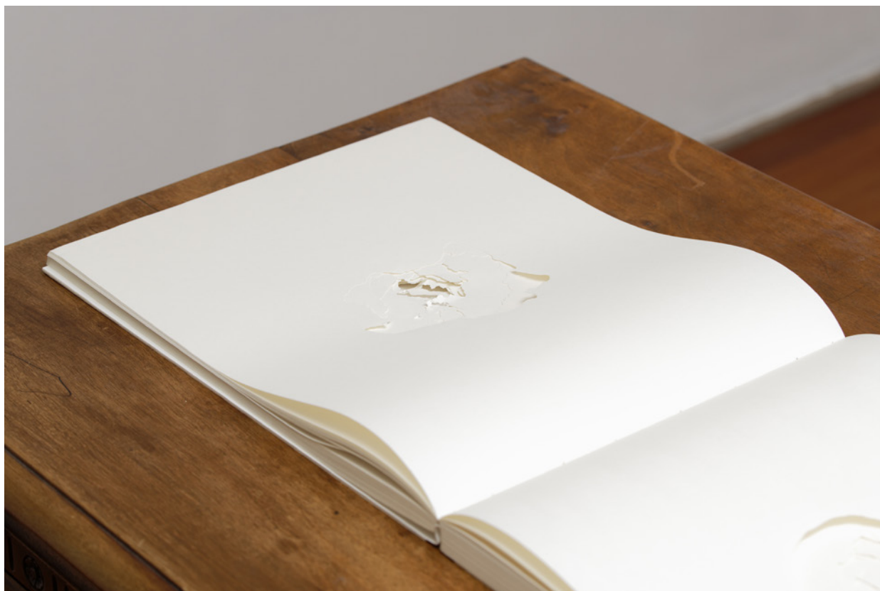
Golnaz Payani, « Oasis », livre d'artiste, 2015, 40 x 30 cm, Courtesy de l'artiste

Un exemple en est l'œuvre Oasis installée à l'entrée de la Villa du Parc. Golnaz Payani a constitué un recueil de cartes de tous les pays de la planète, attribuant à chacun le même protocole de représentation soit, dit autrement, une égalité de traitement. Chaque territoire est isolé, centré dans la feuille, reproduit à la même échelle avec une qualité de découpe rigoureusement homogène, puis évidé. La béance des pages fragilise le livre devenu tridimensionnel et rend sa consultation délicate. Le visiteur est invité à modifier ses habitudes et, littéralement, à lire en creux. Entre ce qui est donné à voir et ce qui est soustrait à la vue - le territoire lui-même - il s'initie à une inversion du mode d'appréciation. Cet exercice touche à la fois au déchiffrement, ce qui est vu, et à l'identification, ce qui est lu et fait appel au savoir.