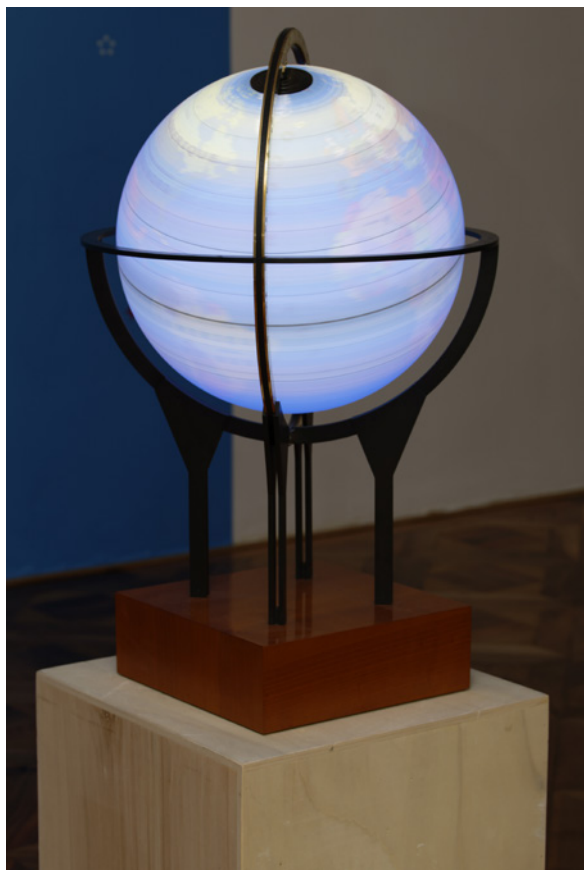
Fayçal Baghrich, « Souvenir », globe terrestre lumineux et moteur, 2012, Courtesy de l'artiste et Galerie Jérôme Poggi, Paris

L'œuvre Souvenir de Fayçal Baghrich est une mappemonde lumineuse, installée dans la pénombre, dont la vitesse de rotation engloutit les pays et les continents dans un mélange optique à dominante bleue, conséquence de la prépondérance du code coloré des océans. Seuls les parallèles et l'équateur demeurent visibles et l'objet de connaissances perd son statut, se transformant en une image mobile et luminescente. Cette dernière nous rappelle - souvenir - les photographies, prises par les astronautes au siècle dernier, qui par l'impression de décentrement, due au point de vue inédit depuis un satellite, et par l'attrait de la couleur bleutée, due aux fréquences des longueurs d'ondes du rayonnement de la planète, ont durablement frappé l'imaginaire collectif.