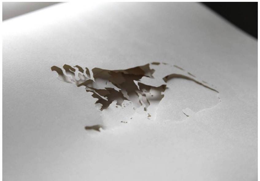
Golnaz Payani, Oasis , 2015