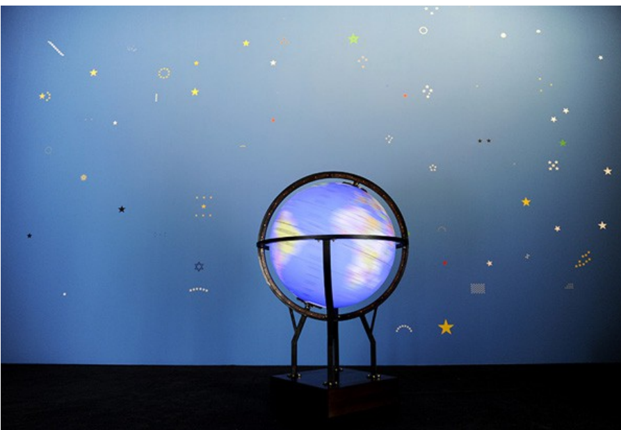
Fayçal Baghrich, Souvenir , 2012 et Epuration électorale , protocole d'installation, 2009