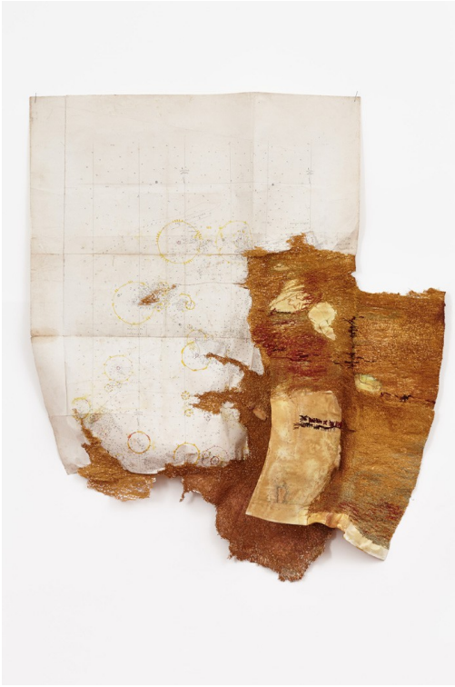
Cathryn Boch, Sans titre , 2017