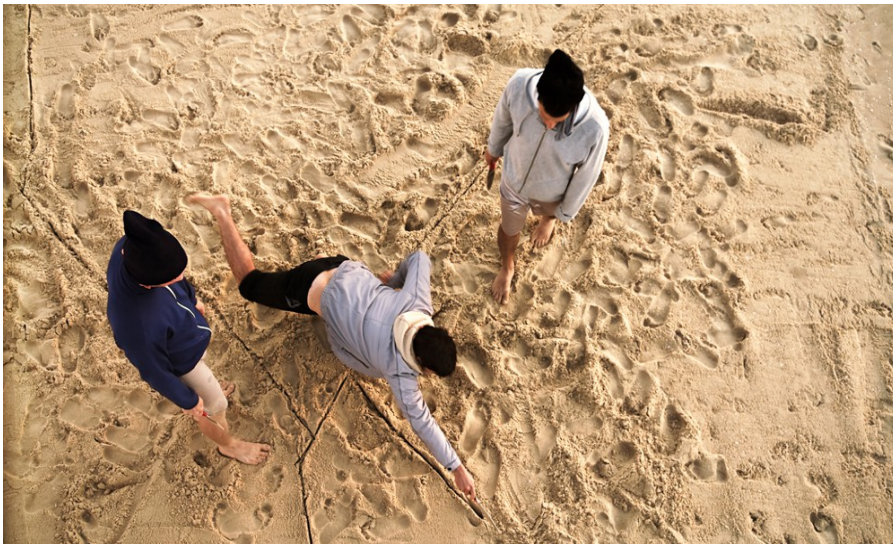
Sigalit Landau, Azkelon , 2011