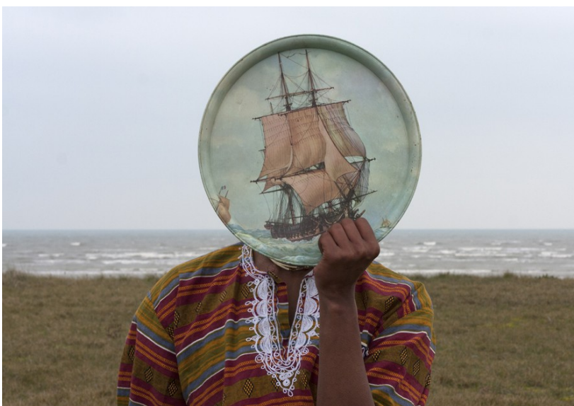
Julien Creuzet, Horizon introspectif , 2010