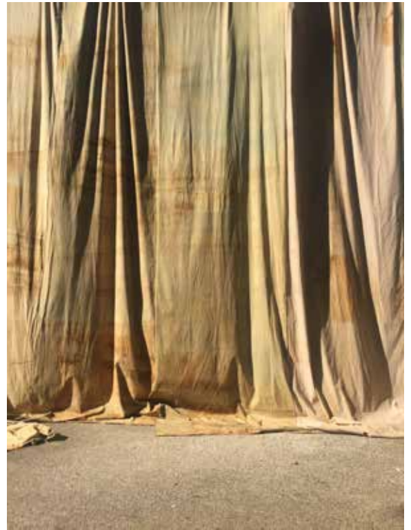
Adrien Vescovi, Chunking , 2016

l'une à Tripode (Nantes et l'autre dans le Projectspace Galerie NosbaumReding (Luxembourg). En 2016 son travail a été montré dans différentes expositions de groupe, à la galerie Praz Delavaladde (Paris), au centre d'art contemporain La Galerie (Noisy-le-Sec) ou la Kunsthal Charlottenborgh (Copenhague). http://adrienvescovi.tumblr.com/