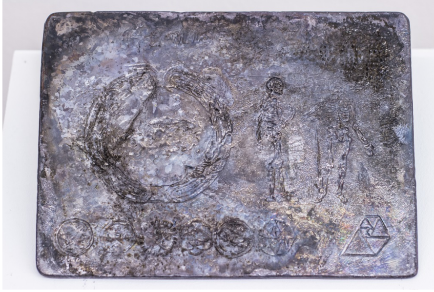
Benoît Billotte «Pioneer», Plaque en plomb moulée, 23 x 17 cm, 2011